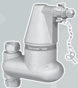
FLAMCOVENT SOLAR V